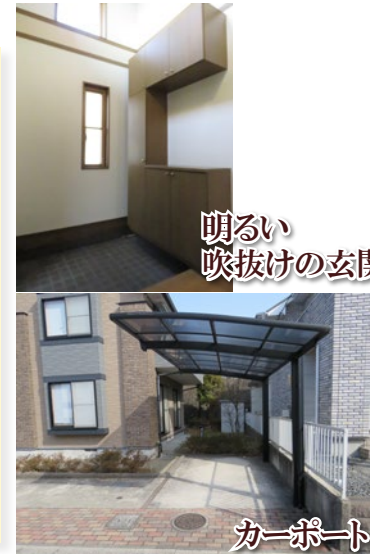
明るい 吹抜けの玄関